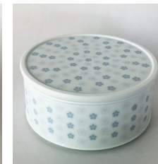
(lid/ おつまみ重箱蓋) 120φ×h10 ¥1,000(税別)