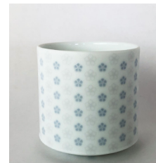
(8oldglass/エイトオールド) 80φ×h80 270cc ¥1,500(税別)