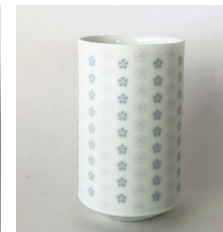
(tumbler/タンブラー) 65φ×h105 250cc ¥2,000(税別)