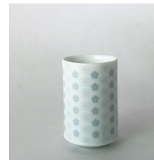
(shotglass/ショットグラス) 40φ×h65 60cc ¥1,000(税別)