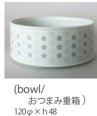
(bowl/ おつまみ重箱) 120φ×h48 ¥2,500(税別)