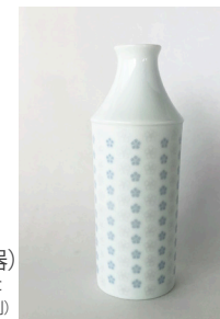
(sake bottle/酒器) 55φ×h150 200cc ¥2,000(税別)