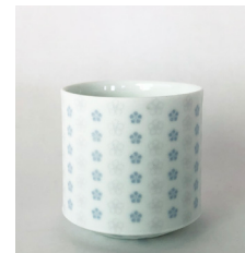
(goldglass/シックスオールド) 70φ×h70 200cc ¥1,500(税別)